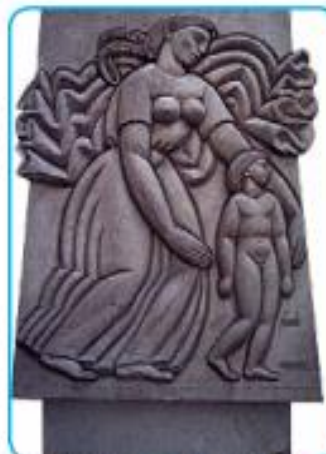
La Educación. Francisco Narváez. Relieve, fachada de la escuela Francisco Pimentel. Caracas. 1956.

¿Qué diferencias observas entre estas dos obras de arte?