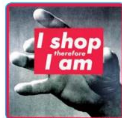
Compro, luego soy. Bárbara Kruger. Fotografía. 1987. USA. Arte contemporáneo.

En el relieve La Educación de Francisco Narváez se pueden observar formas figurativas rotundas y sintéticas, además de estar presente una conciencia humanista de temática social sobre la realidad venezolana. Por otra parte, en obras como la fotografía de la artista Bárbara Kruger, cuyo título se puede traducir como "Compro, luego soy" –parafraseando al filósofo René Descartes "Pienso luego existo"– destaca la intención de generar una reflexión acerca de la sociedad contemporánea caracterizada por el consumo irracional y enajenante.