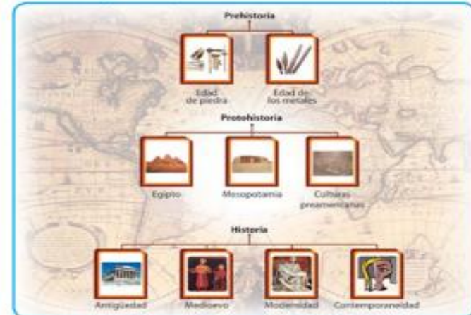
Diagrama de la producción artística a través del tiempo

Los historiadores científicos expresan ese tiempo con los términos antes de nuestra era y en nuestra era , en el sentido de que la historia se escribe de manera científica con escrituras universales y con la ayuda de las otras ciencias –arqueología, antropología, economía, sociología, etc.