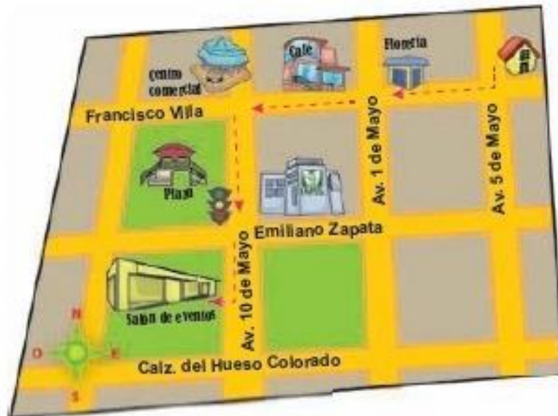
Croquis de Felipe