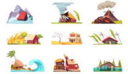
Fenómenos Naturales y Desastres

"Asumo comportamientos seguros ante situaciones de riesgos naturales y de violencia social"