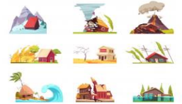
Fenómenos Naturales y Desastres

"Asumo comportamientos seguros ante situaciones de riesgos naturales y de violencia social"